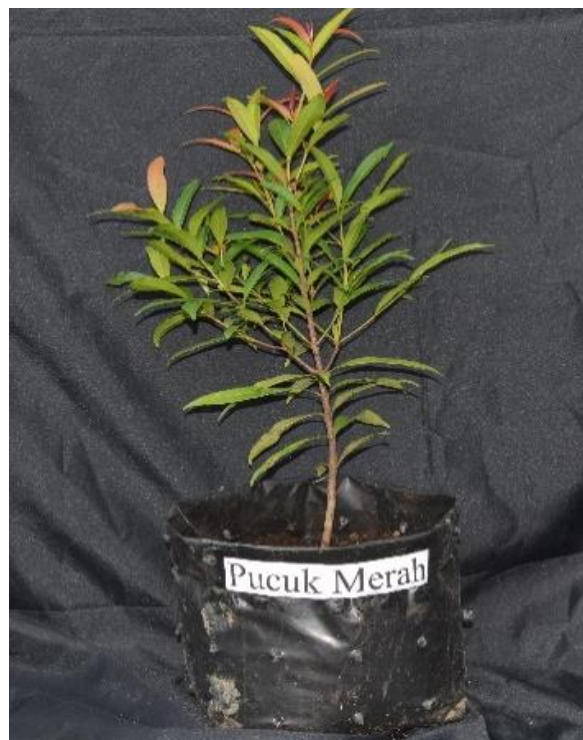
Gambar 1 Pengambilan sampel dari tiga bagian tanaman hias dikotil.

Daun diambil untuk pengukuran ketebalan daun dan laju transpirasi pada pukul 09.00–11.00 WIB untuk mengoptimalkan pembukaan stomata (Fatonah 2013). Stomata yang terbuka penuh akan mendorong terjadinya laju transpirasi yang optimum. Mikrometer dikalibrasi dengan perbesaran pada mikroskop 10x10. Kalibrasi mikrometer ini mengacu pada Haryanti (2010). Kalibrasi perlu dilakukan agar dapat mengetahui berapa nilai untuk setiap skala pada mikrometer okuler jika dikonversikan ke dalam lensa objektif \mu\text{m} . Kalibrasi mikrometer okuler mengacu pada