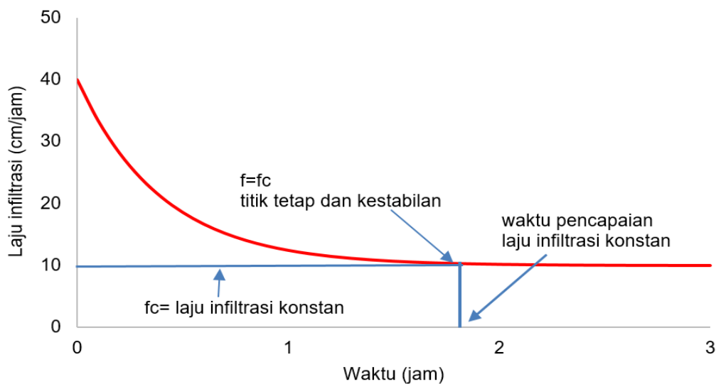
Gambar 1 Penetapan waktu pencapaian laju infiltrasi konstan.

Lahan Kopi. Tanaman kopi di lokasi penelitian berjenis arabika yang telah berumur 10 tahun. Namun, sejak tiga tahun terakhir lahan dan tanaman kopi