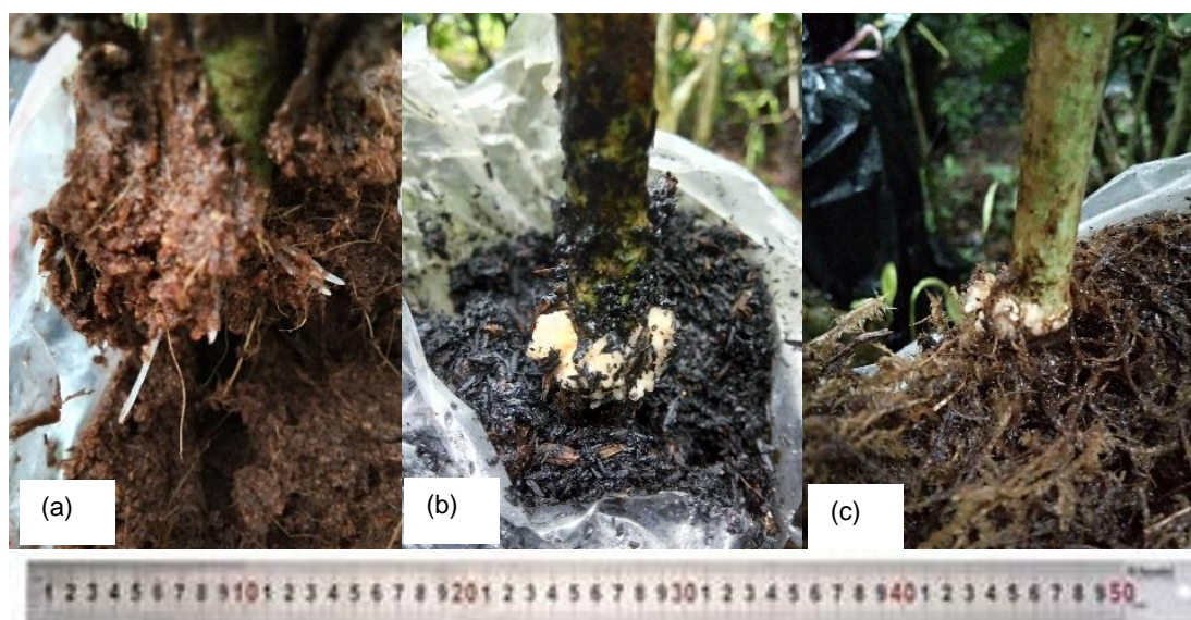
Gambar 2 Akar yang terbentuk pada 8 MSC (a) akar sepanjang ±10 cm pada media serbuk sabut kelapa, (b) media arang sekam yang masih berupa bakal akar, dan (c) media moss yang masih berupa akar pendek ± 1 cm.