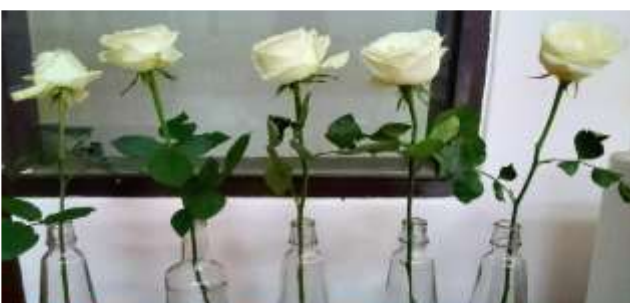
Gambar 1 Penampilan bunga potong mawar setelah penyimpanan selama 7 hari.