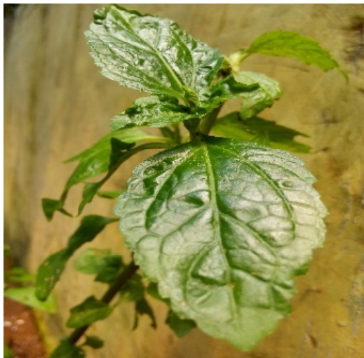
Gambar 1 Tumbuhan Söfö-söfö

Kingdom : Plantae Superdivisi : Spermatophyta Kelas : Mongoliopsida