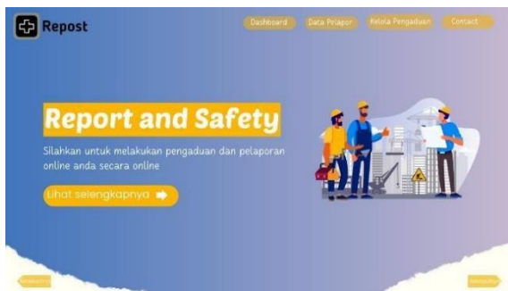
Gambar 2a. Tampilan Awal Repost

Dalam era digital, model yang dibentuk tentunya harus memudahkan masyarakat dalam menggunakan pelaporan dan pengaduan berbasis online untuk menangani keadaan dimana terjadi suatu kondisi mengancam kesehatan dan keselamatan pekerja, sehingga lebih mudah dijangkau dan efisien dari segi waktu, biaya, dan usaha. Berikut adalah ilustrasi dan flowchart yang menampilkan sistem dari platform REPOST sebagai cara dan teknik efisiensi instansi dalam pelaporan dan pengaduan k3.