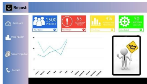
Gambar 2b. Tampilan Dashboard Repost