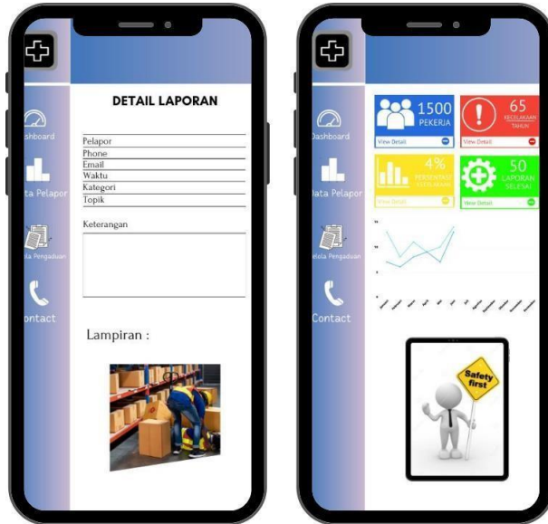
Gambar 4. Tampilan Repost Pada Hand Phone