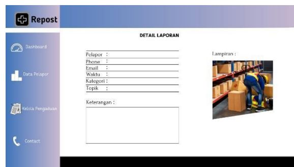
Gambar 3. Tampilan Format Pelaporan