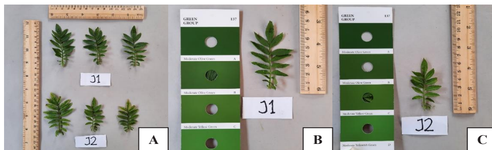
Gambar 2. Keragaan daun marigold T. erecta var. Sudamala Oranye 1: a) daun tanaman marigold akibat pengaruh frekuensi pinching dan jenis pupuk, b) warna daun tanaman marigold dengan perlakuan pupuk AB Mix, c) warna daun tanaman marigold dengan perlakuan pupuk NPK + Gandasil. (J1) AB Mix 1000 ppm dan (J2) NPK 16-16-16 5000 ppm + Gandasil 2000 ppm.

Keterangan: angka yang diikuti huruf berbeda pada kolom yang sama adalah berbeda nyata berdasarkan uji BNJ taraf 5%, (J1) AB Mix 1000 ppm dan (J2) NPK 16-16-16 5000 ppm + Gandasil 2000 ppm.