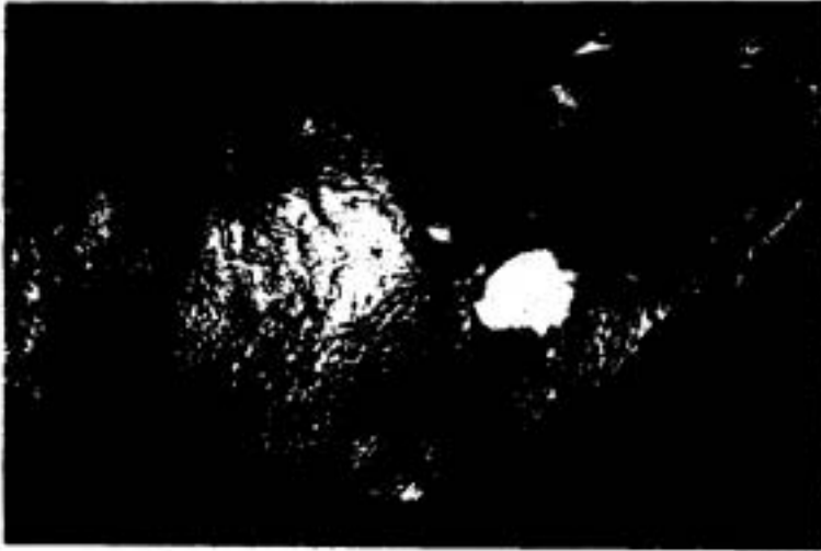
Gambar 1. Abses (anak panah) pada limpa seekor babi yang diperiksa di rumah potong hewan (RPH) merupakan salah satu tanda kelainan patologi anatomik dari melioidosis