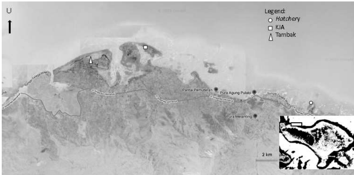
Figure 1. Map of research locations (hatchery, sea cage and pond) in North Bali.

Benih ikan kerapu sunu (panjang 6,56 \pm 0,52 cm dan berat 4,48 \pm 1,04 g) yang berasal dari hasil pembenihan di hatchery BBRBLPP Gondol dipelihara dalam jaring dengan ukuran 1 \times 1 \times 1 m 3 dengan lebar mata jaring 4 mm yang ditempatkan dalam KJA, tambak dan bak hatchery. Benih ikan kerapu sunu dipelihara dengan kepadatan 50 ekor per jaring atau 50 ekor per m 3 selama 90 hari, dan diberi pakan komersial dengan kandungan protein 48% yang diberikan pada pagi dan sore hari secara adlibitum (sampai kenyang). Pemberian pakan dilakukan secara manual, diberikan sedikit demi sedikit ke dalam jaring.