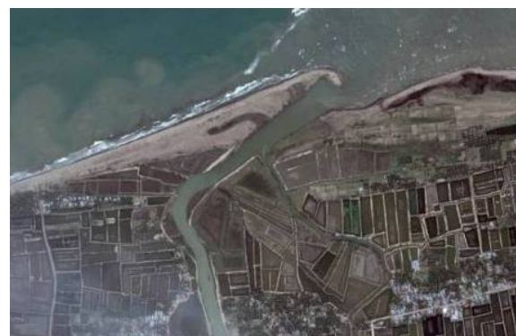
Gambar 2. Kawasan Tambak di Kabupaten Aceh Utara.