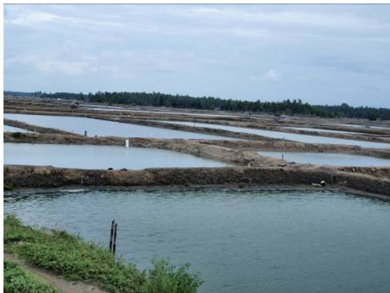
Gambar 1. Bentangan Tambak yang Masih Aktif dengan Kondisi yang Masih Relatif Baik

Keterangan: St-1=Kamban, St-2=Uteun Geulinggang, St-3=Laga Baro, St-4=Matang Baroh, St-5=Alue Serdang, St-6=Matang Karieng, dan St-7=Meunasah Dayah.