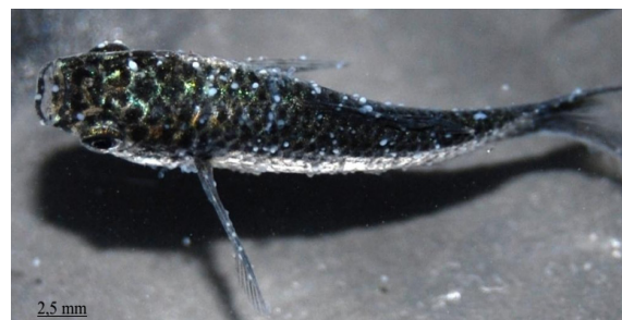
Gambar 3. Ikan black moly Poecilia sphenops yang terinfeksi Ichthyophthirius multifiliis pada uji infektivitas. Titik putih pada tubuh adalah parasit yang telah berkembang menjadi stadia trophont.