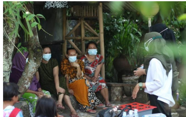
Gambar 3 Salah satu kegiatan offline .

Pembelajaran luring merupakan sistem pembelajaran yang tidak memanfaatkan jaringan internet. Beberapa program dilaksanakan dengan metode tatap muka langsung karena tidak bisa dihindari. Program-program tersebut adalah Program Gerakan Memakai Masker (Gemmas), yaitu program pemberian poster, masker dan handsanitizer serta Gerakan Protein Sehat (GPS) di Cangkurawok, Desa Babakan. Program ini dilaksanakan pada Minggu 25 Juli 2021 di pekarangan rumah bapak ketua RT 02 Cangkurawok, Desa Babakan. Pelaksanaannya dilakukan dengan cara membagikan masker dan