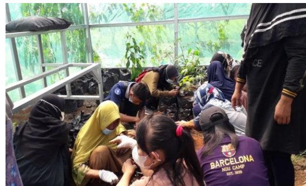
Gambar 5 Pelaksanaan kegiatan gemar menanam.