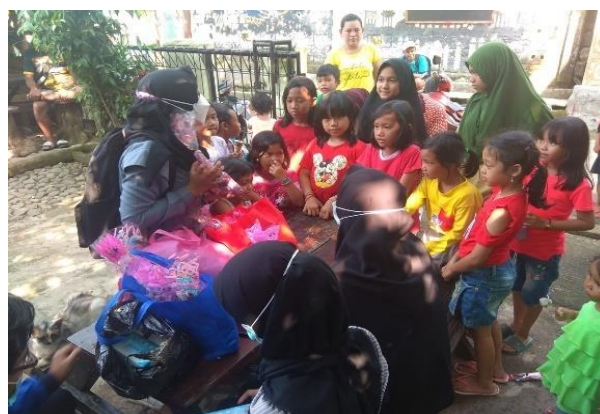
Gambar 6 Masyarakat kurang sadar terhadap prokes pandemi Covid 19.

Mengingat situasi dan kondisi yang ada, pada KKNT domisili kali ini, pelaksanaan kegiatannya dilakukan dengan pendekatan kombinasi daring dan luring ( blended learning ). Bila ditinjau dari gaya belajar seperti yang dijelaskan oleh DePorter and Hernacki (1999), pembelajaran dapat dilakukan dengan 3 gaya, yaitu gaya belajar visual, gaya belajar audio dan gaya belajar kinestetik. Dengan demikian, pembelajaran blended learning , secara otomatis sebenarnya sudah mencakup gaya belajar visual dan audio secara tidak langsung. Sementara gaya belajar kinestetik, peserta mitra dapat diperoleh melalui praktek langsung terbatas. Pelaksanaan pelatihan secara blended learning ternyata telah memberikan alternative baru sistem pembelajaran/pelatihan. Pembelajaran melalui jaringan memiliki kebaikan antara lain kemudahan mengakses materi, karena dapat mencari teks, gambar, suara, data, dan video