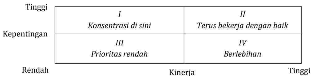
Gambar 1. Diagram Importance-Performance