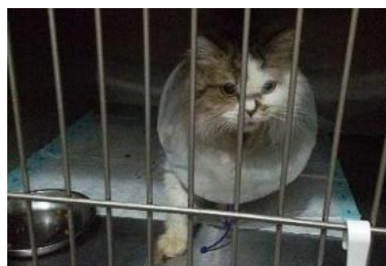
Gambar 1 Kucing Suki yang mengalami urolitiasis.

Sinyalemen: Kucing dengan ras persia bernama Suki dengan jenis kelamin betina dan rambut berwarna putih abu-abu (Gambar 1). Anamnesa: Pemilik membawa kucing ke klinik My Vets dengan keluhan sulit urinasi dan menunjukkan respon sakit saat miksi. Sebelumnya pernah dibawa ke klinik dengan keluhan stranguria dan hematuria. Gejala klinis: Suhu tubuh 38.3°C, frekuensi nafas 36 kali/menit, frekuensi jantung 124 kali/menit, vesika urinaria tidak tegang dan terdapat darah pada urin (hematuria). Pemeriksaan penunjang: Pemeriksaan radiografi ditemukan masa radioopaque pada bagian vesika urinaria (Gambar 2). Diagnosa: Urolitiasis. Prognosa: Fausta.