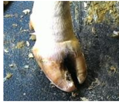
Gambar 3. Kuku sapi yang telah dirapikan

Pemotongan pada bagian sole dilakukan secara hati-hati agar tidak terlalu dalam dan sampai melukai pembuluh darah yang terdapat pada bagian kaki sapi. Hasil kuku yang telah dirapikan dapat dilihat pada Gambar 3.